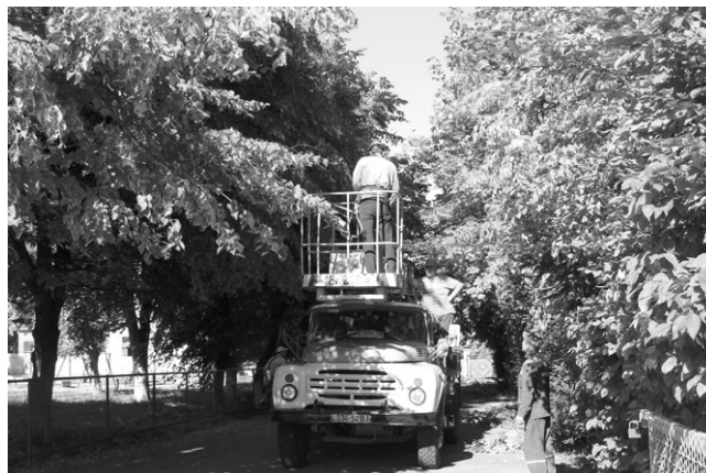
Стометрова алея до початку роботи

Спочатку хлопці обрізали гілки дерев самотужки, потім