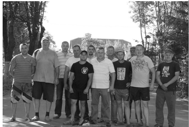
Результат спільної праці

Й справді, не помітити різницю було важко. Адже якщо ще зранку алея була у затінку, гілля нависало над парканами й навіть трохи заважало пройти, то уже ввечері шкільна алея виглядала впорядкованою, світлою та прибраною й головне - безпечною для школярів. Результат оцінили чимало хуторян, були серед них й батьки учнів, які наголосили, що тепер територія навчального закладу й справді зараз виглядає набагато естетичніше, а головне - безпечніше.